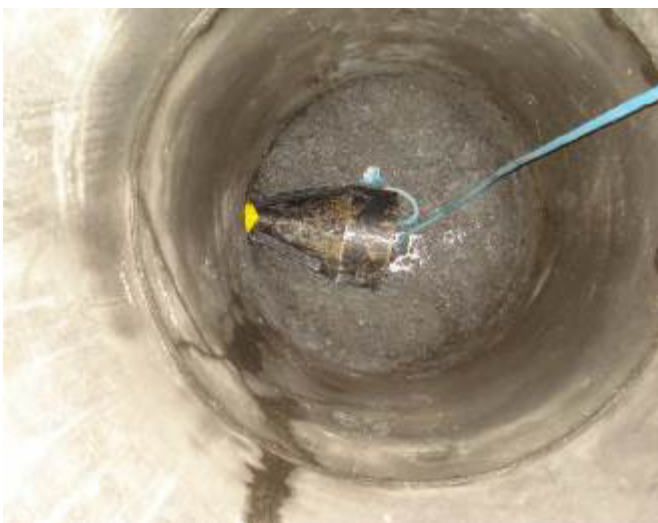
Der Berstkopf im 600 mm Schacht.