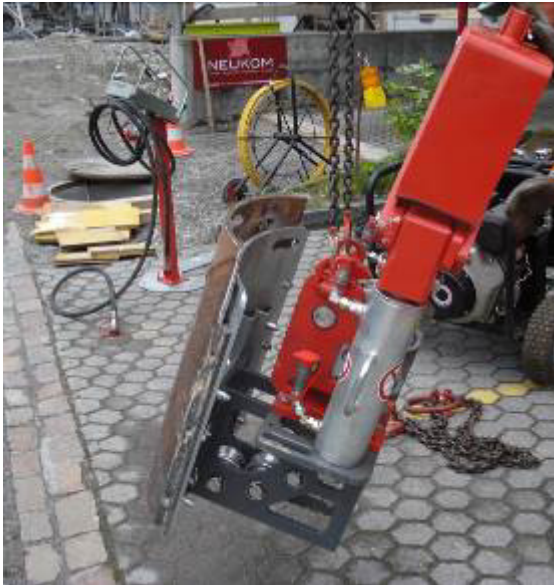
Der Seilberster X 300 C mit gebogener Frontplatte wird im Ø 800 mm Schacht installiert.