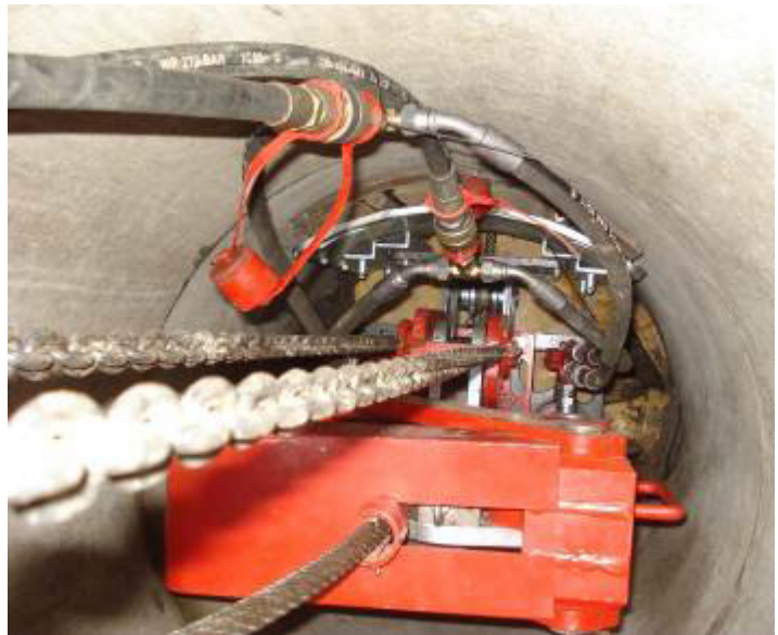
Der Seilberster X 300 C im Ø 800 mm Schacht.